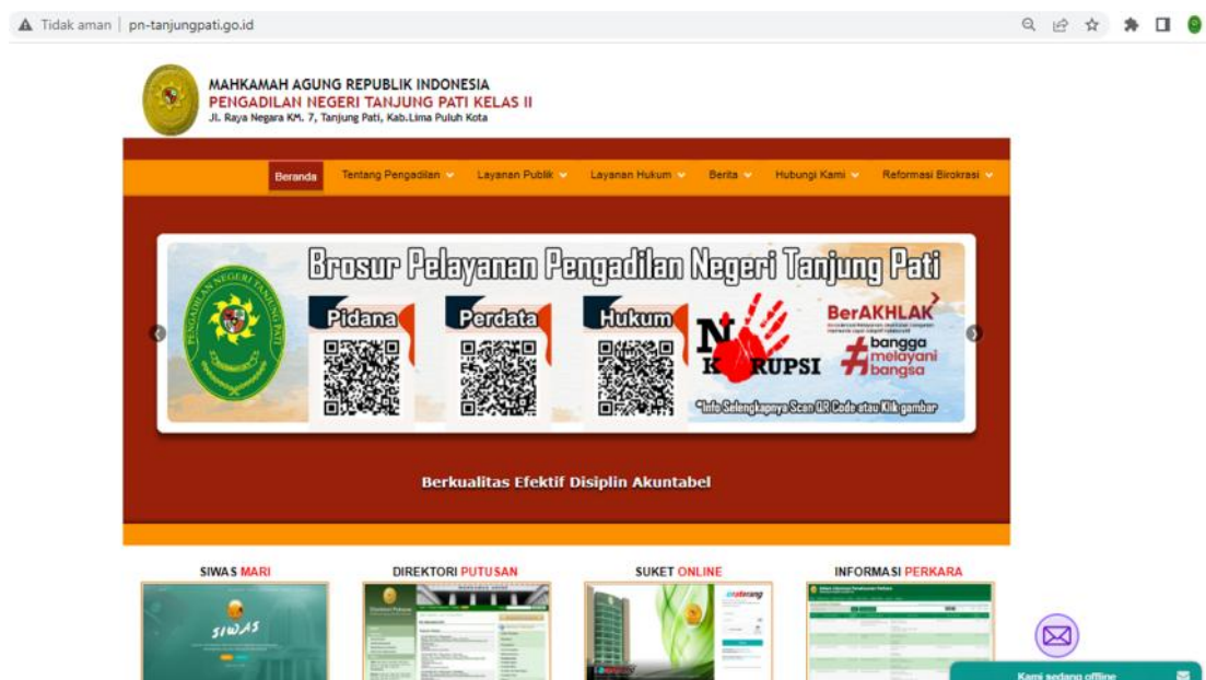
Gambar 1. Website Pengadilan Negeri Tanjung Pati

Masyarakat dapat mengunduh informasi publik yang tersedia pada website resmi Pengadilan Negeri Tanjung Pati, yaitu http://pn-tanjungpati.go.id/ .