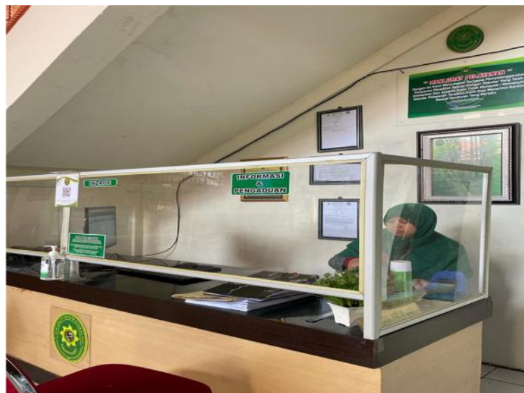
Gambar 3. Meja Informasi Pengadilan Negeri Tanjung Pati

Pengadilan Negeri Tanjung Pati menyediakan sarana keterbukaan informasi secara langsung bagi pengunjung berupa Meja Informasi pada ruang Pelayanan Terpadu Satu Pintu (PTSP) yang letaknya dibagian depan/lobi gedung Pengadilan. Berdasarkan SK Ketua Pengadilan Negeri Tanjung Pati setiap harinya telah ditunjuk petugas piket Meja Informasi dan petugas meja pengaduan. Petugas Meja Informasi bertugas untuk memberikan penjelasan ataupun mengarahkan masyarakat dalam mendapatkan informasi. Operasional pelayanan permohonan informasi publik dilaksanakan setiap hari Senin s.d Kamis mulai pukul 08.15 WIB s.d. pukul 16.30 WIB dan hari Jumat mulai pukul 08.15 WIB s.d. pukul 17.00 WIB.